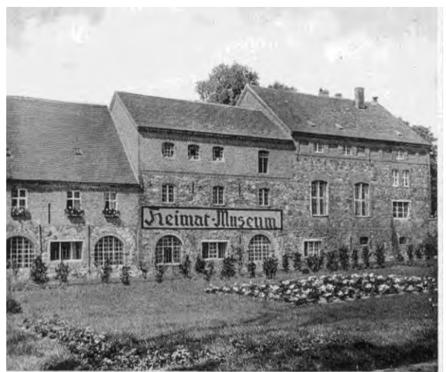
Einer der „Lost Places“